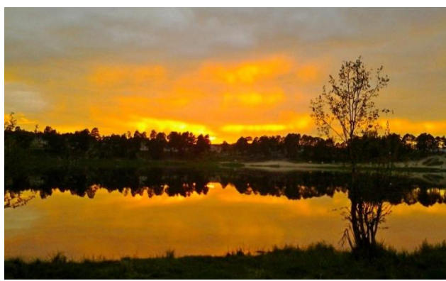
Чудесно Святое озеро на закате!

На планете Земля проживают около семи миллиардов человек. Не важно, где ты живёшь, всё равно природа окружает тебя всю жизнь. Но задумываемся ли мы о природе? А ведь как она прекрасна, какие чудесные минуты наслаждения мы получаем, любуясь ею...в городе, в его окрестностях... Вспоминаем ли мы о ней когда – то, кроме тех случаев, когда нам нужно воспользоваться её ресурсами?