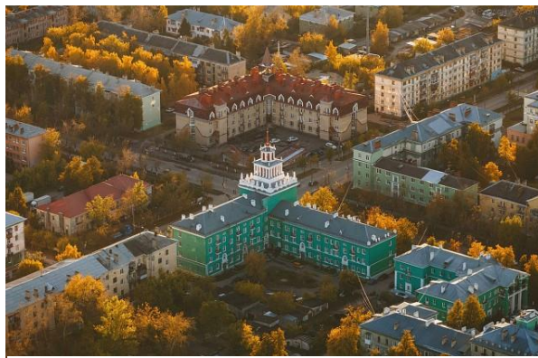
Городской пейзаж сверху

Сохранять и приумножать природные богатства - обязанность каждого из нас, что и делают члены волонтерского объединения «Энергия жизни» МБОУ «Средняя школа №18».